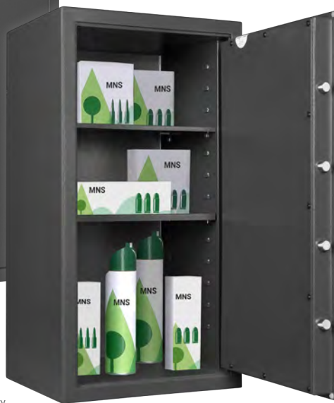
MNS 810 Graphitgrau • graphite grey Dekoration nicht im Lieferumfang enthalten • decoration not included in the delivery

■ Versicherungssumme nach Absprache mit dem Versicherer