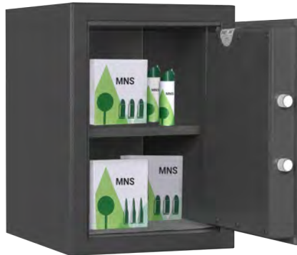
MNS 210 Graphitgrau • graphite grey Dekoration nicht im Lieferumfang enthalten • decoration not included in the delivery